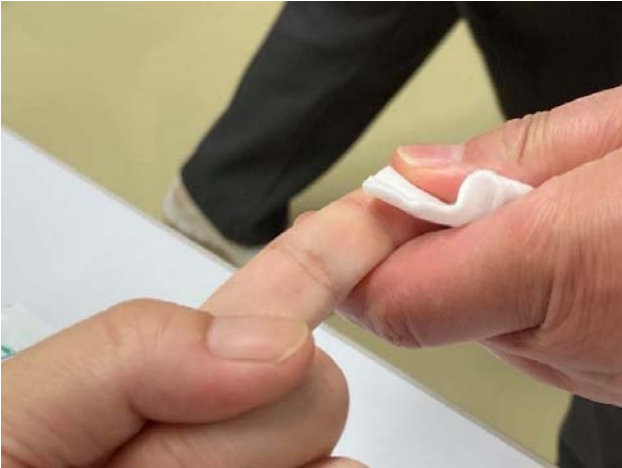
① 指先をアルコール消毒