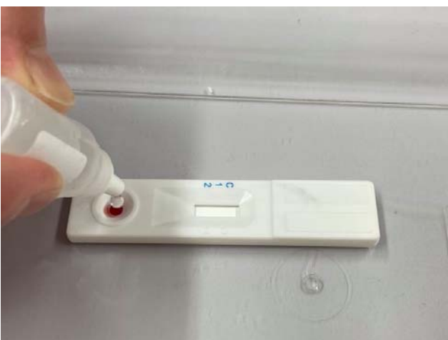
⑤ 反応液を検査キットに注入し 15 分待つ